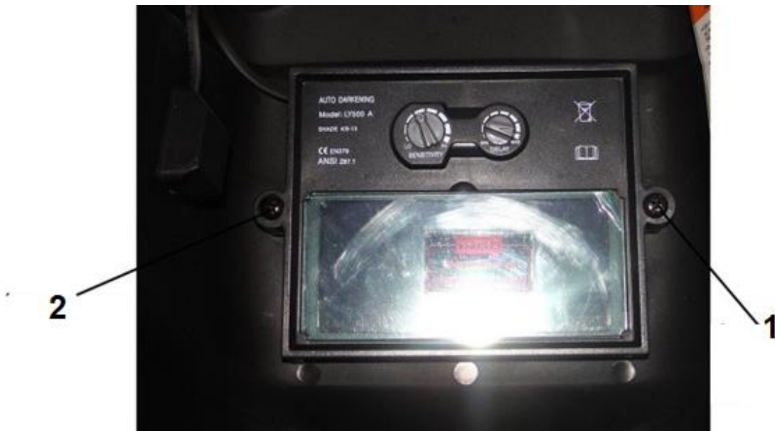
1. Upevňovacia skrutka rámu filtra 2. Upevňovacia skrutka rámu filtra

Vonkajší kryt je nahradený odskrutkovaním 2 skrutiek upevňujúcich rám. Po uvoľnení rámu by ste mali nadvihnúť celý filter, pod ktorým je umiestnený predný kryt filtra.